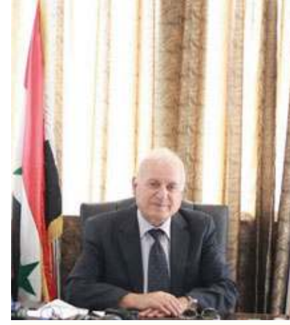
بقلم أ.د. عزّات قاسم رئيس الجامعة - رئيس التحرير