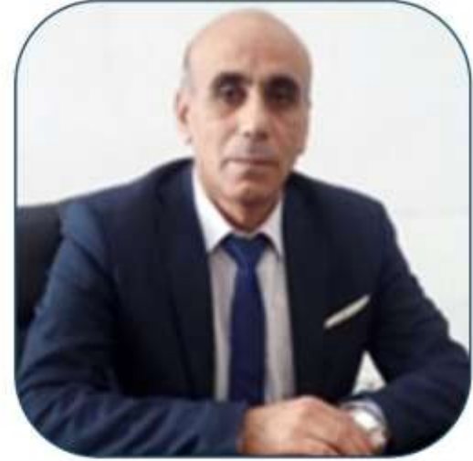
بقلم الأستاذ الدكتور أسامة الفراج

امتحانات الفصل الدراسي الثاني للعام 2023-2024 في جامعة الجزيرة الخاصة