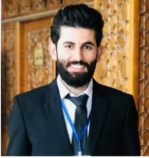
بقلم عبد الله طلال النجرس

رئيس فرع جامعة الجزيرة الخاصة للاتحاد الوطني لطلبة سورية